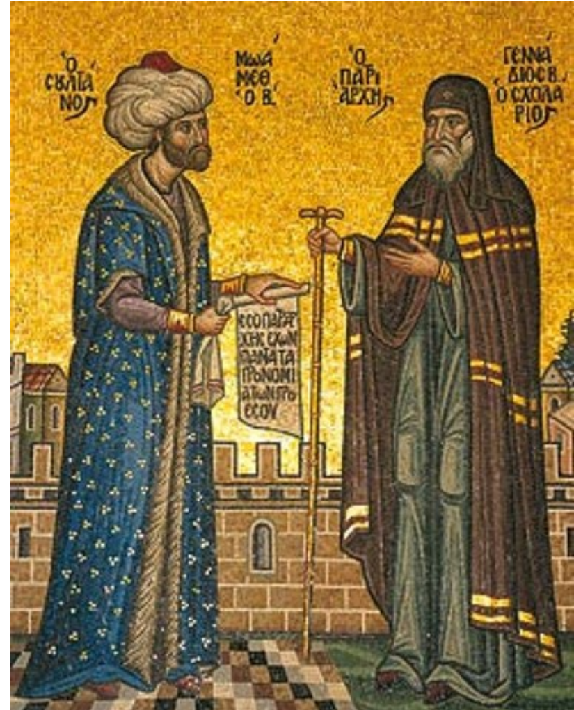
Sultan Mehmed der Eroberer und Patriarch Gennadios