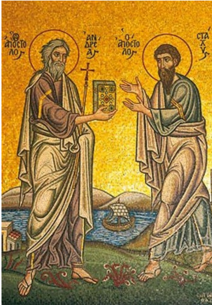
Apostel Andreas und Stachys, erster Bischof von Konstantinopel